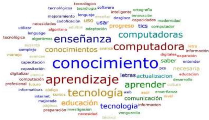
Imagen 1 Alfabetización tecnológica. Asociación de palabras

Sobre la pregunta ¿prefieres leer textos digitalmente (en dispositivos móviles o computadora) o físicamente (en impreso)? los resultados son sorprendentes: Un 58% (58) contestó que el impreso; un 34% (34) de las dos maneras. Sólo 4% (4) declaró que prefiere leer textos en digital y el resto (4%) o sea cuatro alumnos que era indistinto. Al revisar las respuestas por licenciatura se advierte que en el caso de Comunicación, un 50% prefiere en impreso y sólo un 2.7, en digital; en Derecho, cerca de 70% en impreso y únicamente un 2.7% en digital; En Ciencia Política y Administración Pública, casi un 54% lo prefiere en impreso aunque un 41% declara que de las dos maneras.