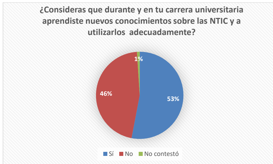
Gráfico 3 Adquisición de nuevos conocimientos

El 88% de los encuestados expresó que sí cuenta con servicio de internet en su hogar. Otro dato interesante lo constituye la respuesta al uso del internet de los encuestados. Más de la mitad (51%) afirmó que lo usa “mayormente para otras actividades” en tanto que un 48% expresó que “mayormente” para actividades escolares. Estas cifras manifiestan un ascenso en la utilización del internet para fines educativos aunque el porcentaje que lo usa para otras actividades sigue siendo alto.